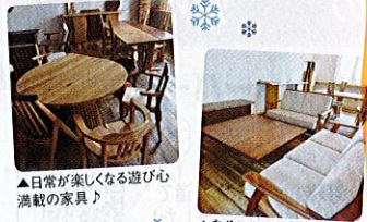
▲日常が楽しくなる遊び心満載の家具♪