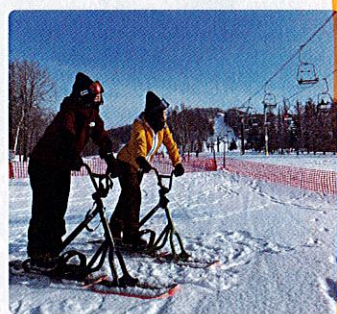
▲新感覚のウィンタースポーツで楽しもう