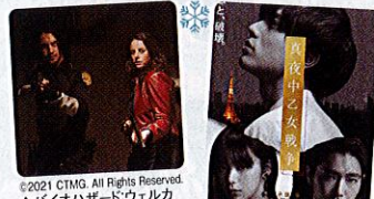
©2021 CTMG. All Rights Reserved. ▲バイオハザード:ウェルカム・ムトゥ・ラウンジティ(2022年1月28日公開)