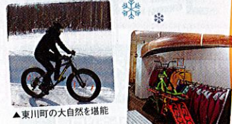
▲東川町の大自然を堪能