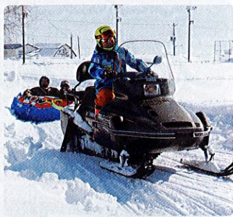
▲迫力満点!ラフトボート!親子で乗ってみてね♪