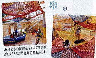
◆天井の大型ネットは雲の上にいるような感覚