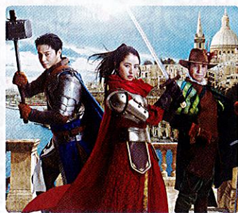
©2021 Confidant Man J.P. 製作委員会 ▲Confidant Man J.P. 英雄編(2022年1月14日公開)