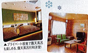
▲プライベート感覚で露天風呂も楽しめる。露天風呂付和洋室!